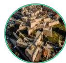
FORT SAINT-NICOLAS MARSEILLE